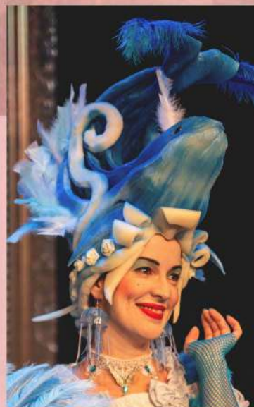
ESTEFANÍA BOTELLA PELEGRÍN

Estefanía Botella es una talentosa actriz ilicitana con una sólida formación en baile e interpretación para musicales. Su pasión por las artes escénicas la llevó a debutar en el teatro en el montaje "Siete gritos en el mar" del aclamado autor español Alejandro Casona, marcando así el inicio de una exitosa carrera en las tablas.