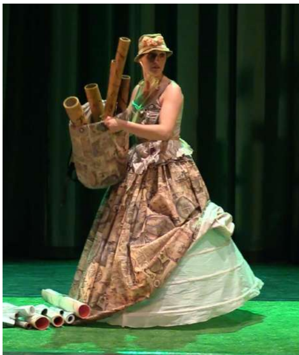
6 La Geògrafa