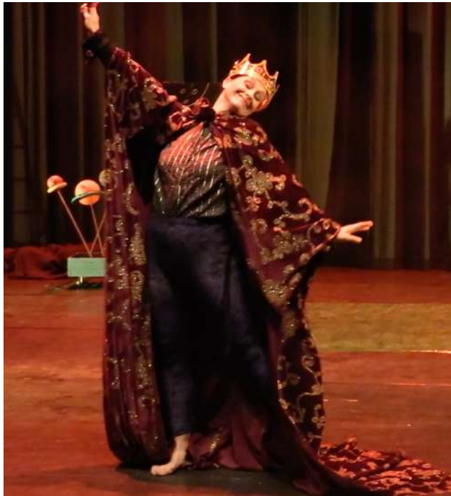
3 El Rei