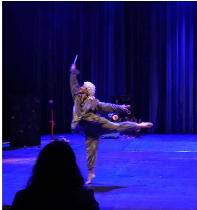
4 El Presumit